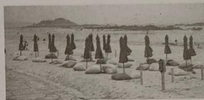
沙滩上新增的懒人沙发

海都讯(记者 梁展豪 通讯员 林彬彬 林君斌 文图) 此前,平潭龙王头沙滩椅坐10分钟被要求收80元的事件引发社会广泛关注(详见4月24日A01版)。昨日记者获悉,龙王头海洋公园新增一个免费休憩点,为游客提供休憩歇脚的场所。